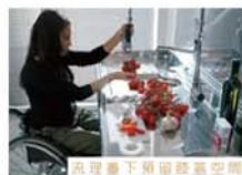
流理臺下預留膝蓋空間